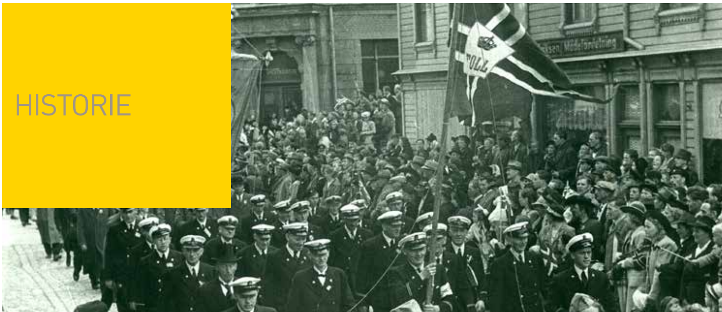
Borgartorget: Her går tollarar i Kristiansand med tollflagget som fane i borgartorget 17. mai 1945.