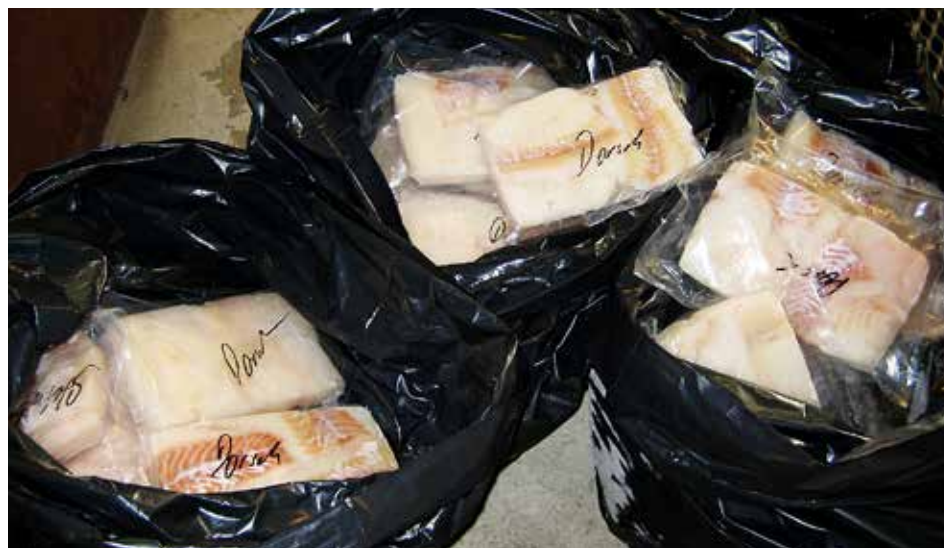
UTENFOR KVOTA: Et av problemene er at mange underdeklarerer fisk.

– Vi har også sett at fisk blir eksportert uten at den er tolldeklart, og det er nærliggende å mistenke at dette gjøres for å bli kvitt fisk som er tatt opp utenfor kvota. Med andre ord er det muligheter for å skjule uregistrert