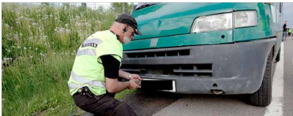
BLIR AVSKILTA: Er ikkje årsavgifta betalt no, risikerer du å få bilen avskilta.

Det største sigarettbeslaget hittil i år blei gjort på Kongsvinger 19. april på E16 ved Masterudkryset. Til saman blei det funne 621 980 sigarettar i ein latviskregistrert lastebil. Det var då sjåføren skulle reparere det eine framhjulet at tollarane blei mistenksame. Dei reagerte på at lasteromet verka for kort, og oppdaga sigarettkartongar i eit spesialkonstruert rom. Det blei òg funne 11,4 liter brennevin og 44 957 kroner.