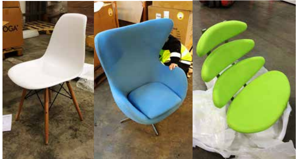
PIRATKOPIER: Disse stolene er falske, og ble beslaglagt og destruert av tollkontoret i Skippergata.

– Varemerkeforfalskning kan drepe, sier han, og viser til skrekkeksempler der personer har fått store helseskader ved å bruke falske legemidler. Forfalskningen har gått så langt at Europol finner falske produkter som egg, airbager, kondomer, bildeler og mye mer. Fellesnevneren for produktene som blir avslørt er at de ofte inneholder farlige stof-