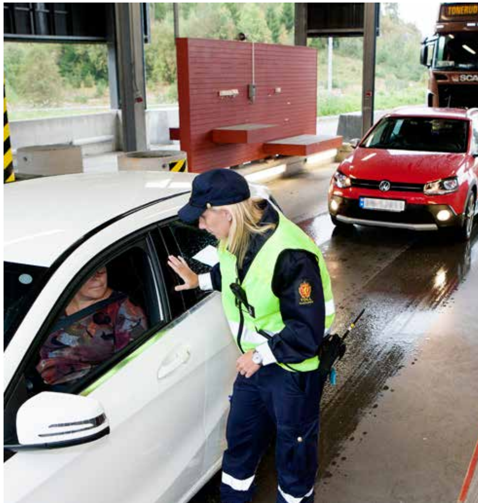
Nye oppgaver: Tollvesenet har også overlevert regjeringen ønske om nye oppgaver som utnytter etatens fortrinn som grensemyndighet.