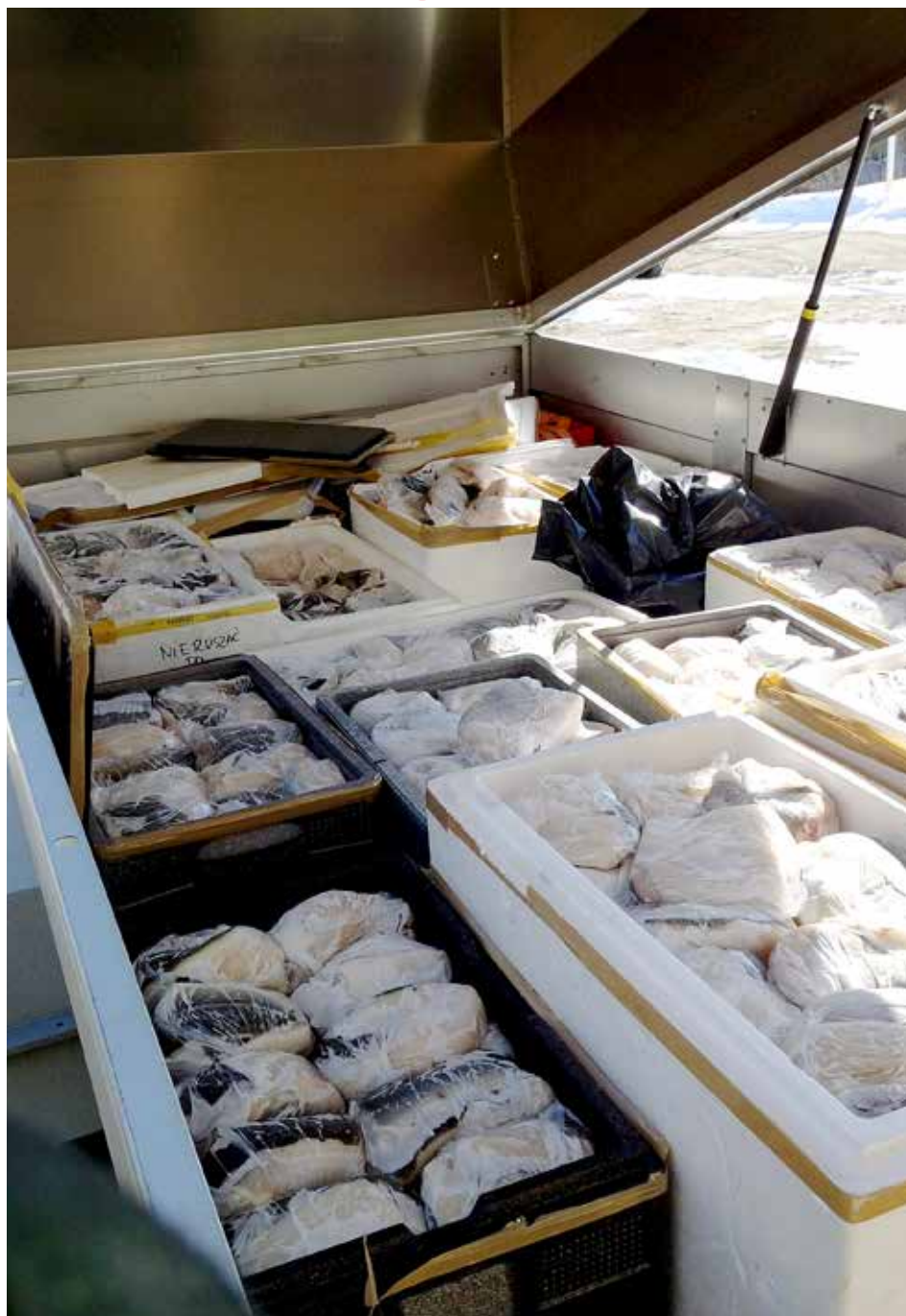
BESLAGLAGT: Denne hengeren med 400 kilo fiskefilet ble stanset av tollere ved Kivilompolo tollstasjon.

I gruppen utveksles erfaringer, modus og annen åpen informasjon. I det internasjonale samarbeidet er tollavtalene kanalen for utveksling av taushetsbelagt informasjon mellom tollmyndighetene. Har Tollvesenet allerede etablert en tollavtale, åpner det for informasjonsutveksling om enkeltsaker.