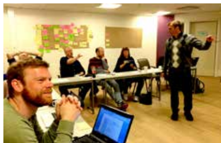
DETALJPLANLEGGINGA: Prosjektgruppa planlegg detaljane i konseptet.