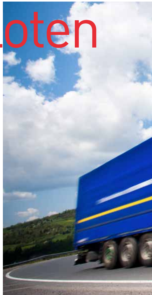
PILOT: Vil effektivisere og utbetre grensekontrollen.

– Når køyretøya kjem til grensa, blir dei