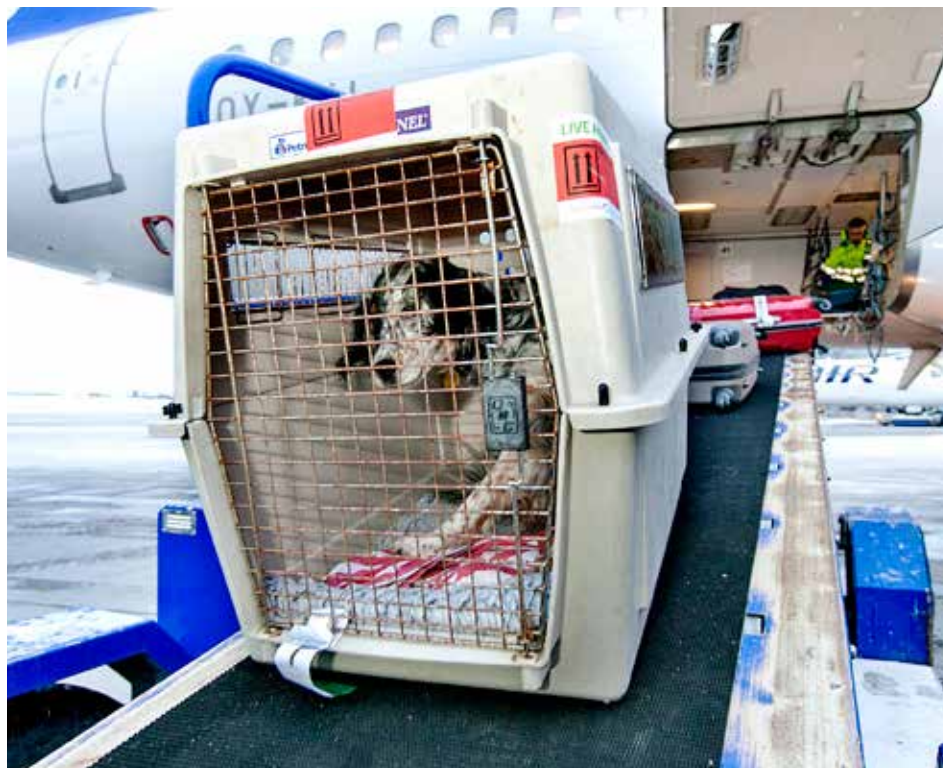
UT PÅ TUR: Før du legg ut på reise med kjæledyret ditt, må du sjekke kva reglar som gjeld for inn- og utreise.

RÅD | SPØR TOLLVESENET: Har du spørsmål du trur Tollvesenet kan hjelpe deg med å svare på, bør du oppsøkje sida «Spør Tollvesenet» på Facebook. Der kan du stille spørsmål og få svar frå infosenteret til etaten. Kanskje har nokon alt spurt om det same som du lurar på. Facebook-sida er bemanna mellom 08.00 og 15.30.